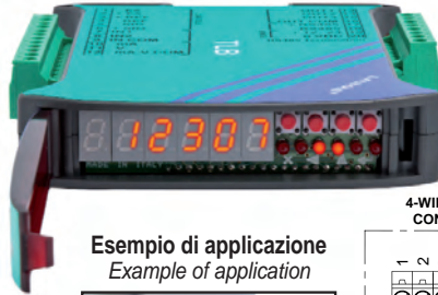
Esempio di applicazione Example of application